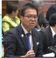
はまぐち誠 参議院議員