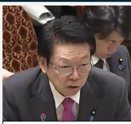
石破茂 内閣総理大臣